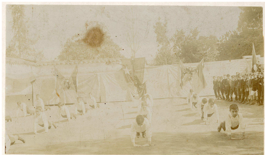
Foto extraída del Archivo Fotográfico del Museo de la Educación Gabriela Mistral. Liceo de Hombres de Quillota, 1910

La representación fotográfica, en este caso debe ser entendida desde las referencias patriótica-simbólicas que inspiran la actividad física (banderas chilenas en el contexto fotográfico). No es solamente la promoción del “cuerpo corregido”, sino que son definiciones que pretenden habilitar el imaginario que, la Educación Física, constituye el tratamiento de los cuerpos de los individuos y en especial de los niños, en el campo de lucha ideológica. Lugar desde el cual - a través de los centros de poder- se prefiguran las diferentes experiencias de vida de los sujetos. Por ello, el lugar de las sociedades gimnásticas se ubica en la promoción ideológica-nacional que, “se inspira en la del militar, abriendo un nuevo campo de actividades, ordenando series inéditas de ejercicios y proponiendo de este modo movimientos a menudo descompuestos y limitados. Su saber lleva a una estricta definición de estos últimos y a la atenta vigilancia de sus trayectorias” 18 .