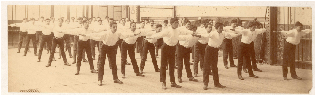
Escuela Normal de Chillán, clase de educación física, 1907

Este concepto de la Educación Física supondrá una superación del juego motor que se ve suplantado por ejercicios regulares prescritos por los educadores físicos de la época bajo unos cánones de ejecución cerrados, y en base a unos tiempos y a unos lugares sistemáticamente ideados y matemáticamente controlados. En todo momento se persigue alcanzar un rendimiento motor en las acciones 19 .