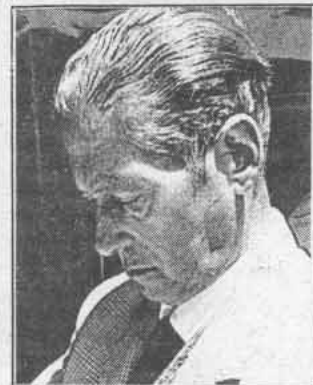
Andariego y errabundo, Guzmán fue un gran novelista.