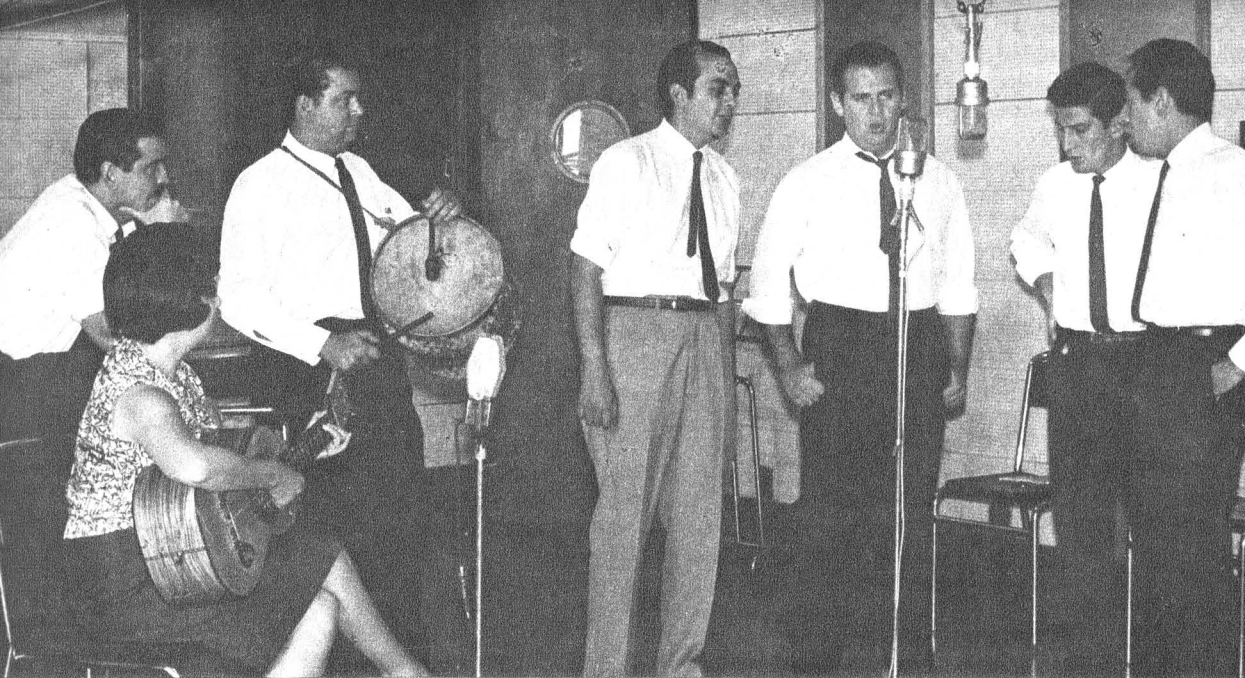
Así se graba una Misa: Los De Ramón y Los Cantores de Santa Cruz.

télefono y nos informó que se estaba vendiendo muy bien. En pocos días, más de mil copias.