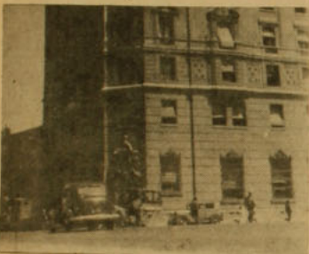
Esta es la alta cota del Ministerio de Hacienda, desde el cual Jorge Alessandri vigilará ahora la marcha de las finanzas públicas. Será su caballo de batalla.

Se interrumpe en seco y hace una especie de quite, como haciendo un flínteo ante un enemigo invisible.