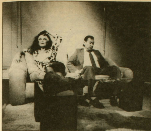
"Tres tristes tigres": sueños de dinero y poderío.

de La remolienda y, ahora, Tres tristes tigres . Al momento del estreno de esta última en 1967, Sieveking declaró no conocer la novela homónima del cubano Cabrera Infante, publicada en 1964, poco antes de su ruptura con la Revolución. Años después, "un joven demente que respondía al nombre de Raúl Ruiz" -al decir de Gustavo Meza- realizó la celebrada película, sobre la base de la obra de Sieveking.