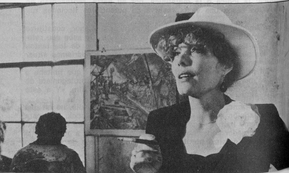
Una escena de «Le Toit de la Baleine»

En el plano técnico hay una exploración perpetua de los efectos obtenidos por los trucajes (a menudo simples, tal y como corresponde a los medios económicos de que Ruiz dispone para rodar sus películas): sobreimpresiones hechas en el rodaje, cambio focal y de orientación de la luz en un mismo plano que pasa, por ejemplo, de la trama de un rostro tras una cortina de encaje a la trama de este encaje tras lo que desaparece, mágicamente, el rostro, en una secuencia de Le Toit de la baleine ; juegos con las sombras, contraluces, utilización de lentes anamórficas ( Le Territoire ) y de filtros coloreados bicromáticos; efectos, todos ellos, que producen una alquimia visual que dota a la imagen de una virtualidad infinita.